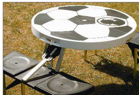
Perfekte Ausrüstung für die EM-Grillparty: Den Campingtisch zur Verfügung gestellt hat der Rintelner Getränkehersteller Schwarze & Schlichte mit seinem „Schwarze Weizen Frühstücksbrot“.

Zu einem schönen Fußball-Abend gehört das gemütliche Grillen im Garten mit Freunden. Und dafür verlost unsere Zeitung gemeinsam mit dem Rintelner Spirituosen-Produzenten Schwarze & Schlichte die passende Ausrüstung: Zu gewinnen gibt es einen Campingtisch für vier Personen im Fußball-Design.