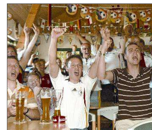
Ein tolles Gemeinschaftserlebnis wie vor zwei Jahren: Zum „Public Viewing“ öffnet sich auch wieder das Vereinsheim des SC Rinteln.